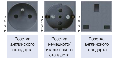
Розетка английского стандарта