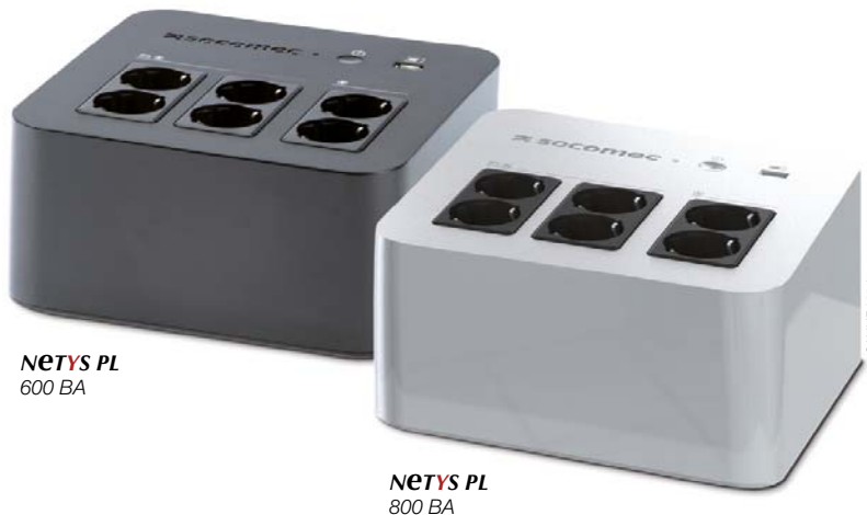
NETYS PL 600 ВА